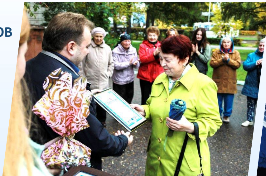
ПОДАРКИ ОТ ПАРТНЕРОВ